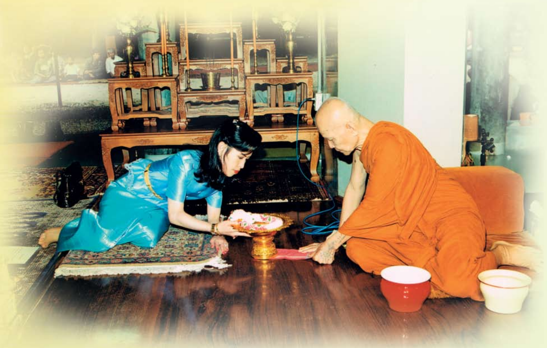
(ภาพพระราชทาน)