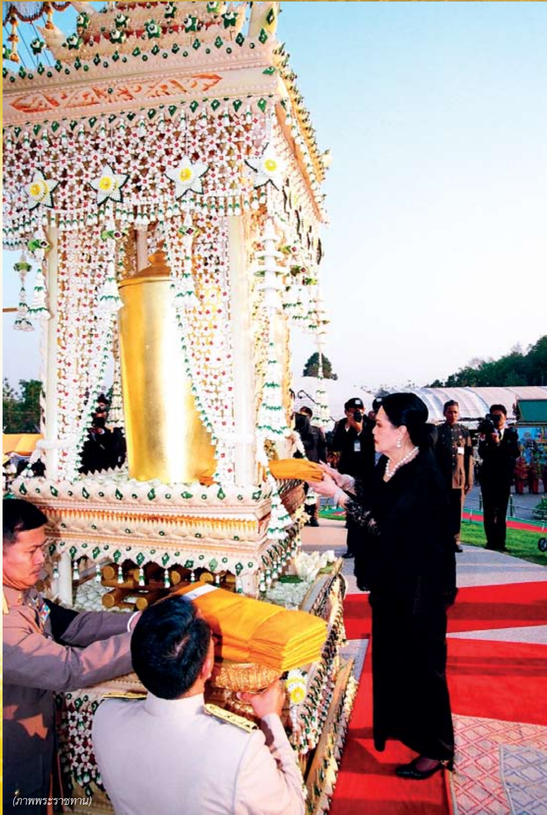
(ภาพพระราชทาน)