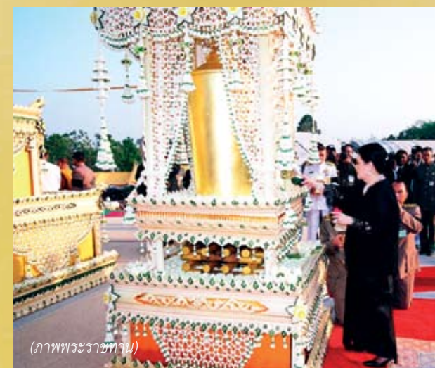
(ภาพพระราชทาน)