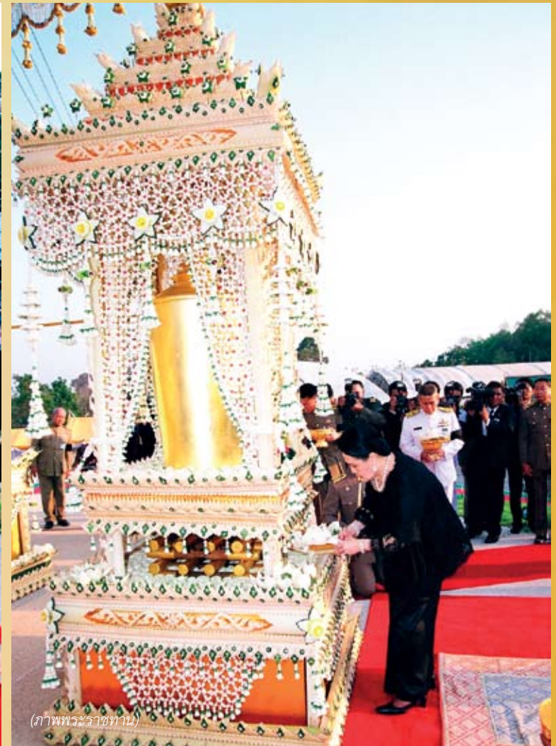
(ภาพพระราชทาน)