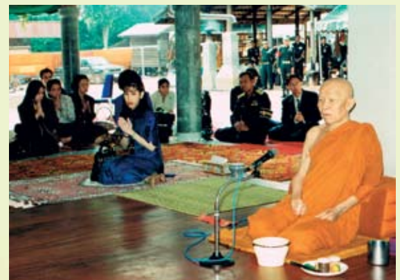
(ภาพพระราชทาน)

ท่านพ่อย้ำสอนให้ลูกมีสติทุกขณะจิต เพราะท่านพ่อบอกว่า คนเราถ้าขาดสติแล้ว ก็จะทำ