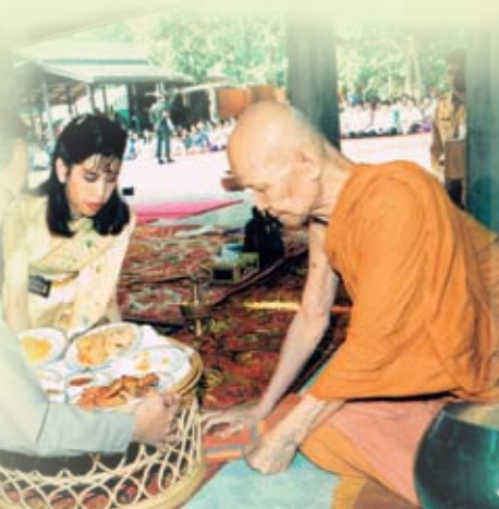
(ภาพพระราชทาน)

ตอนลูกมาเป็นศิษย์ท่านพ่อใหม่ๆ ท่านพ่อ...ดูแลทุกด้าน นอกจากสอนธรรมะให้ลูกแล้ว ท่านพอยังดูแลเอาใจใส่แม้ในด้านสุขภาพของลูก อาทิเช่น ท่านพ่อเห็นลูกผอมมากถึงเวลาท่านพอดันตอนเช้า ท่านพอก็ให้ลูกนั่งรับประทานอยู่หลังเสาที่ท่านพอนั่งอยู่ (ตอนนั้นศาลาวัดป่าบ้านตาดยังมีเพียงชั้นเดียว) ท่านพอมจะหันมาถามลูกว่า “ทานข้าวหรือเปล่า” ลูกก็ตอบไปว่า “ทานเจ้าคะ” ท่านพอก็ถามต่อว่า “ที่ว่าทานนะ ทานข้าวก็เม็ดหรือก็ซ้อน” อันนี้แสดงถึงความเมตตาเอาใจใส่ลูก แม้ประเด็นเล็กประเด็นน้อย