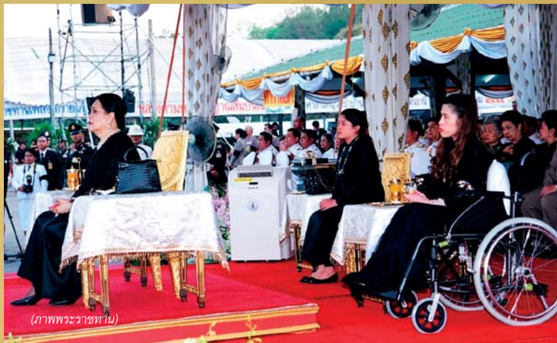
(ภาพพระราชทาน)