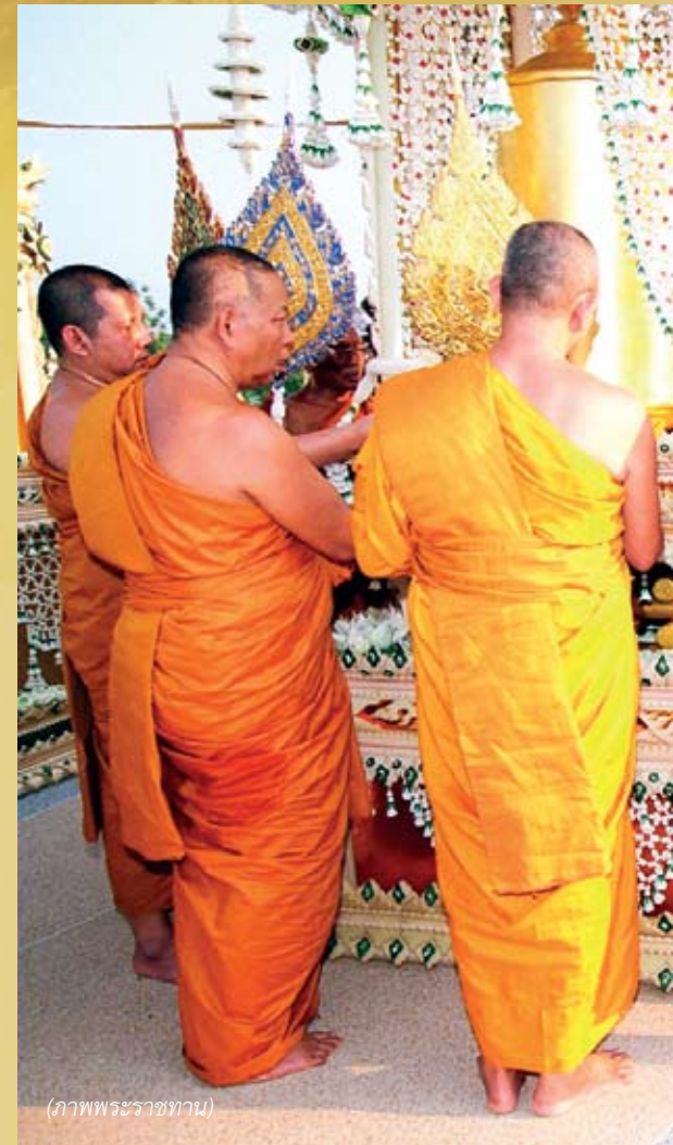
(ภาพพระราชทาน)