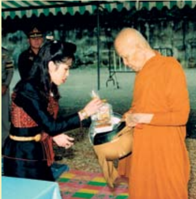
(ภาพพระราชทาน)

B.Sc. (Hons, First Class), Ph. D., C Chem., Hons. F. R. S. C.