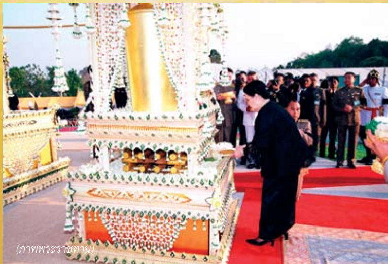
(ภาพพระราชทาน)