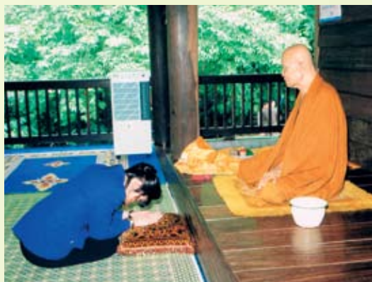
(ภาพพระราชทาน)

B.Sc. (Hons, First Class), Ph. D., C Chem., Hons. F. R. S. C.