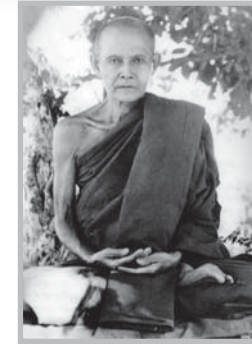
หลวงปู่มั่น ภูริทตฺโต

ความรู้ตามตำรับตำราและความรู้สัมผัสสัมผัส ในการปฏิบัติ จะมาสอนผู้รู้จริงเห็นจริงตามขั้นภูมิ ของจิตของธรรมแห่งผู้ปฏิบัตินี้ มันสอนกันไม่ได้ สอนกันไม่ลง ผู้ที่ปฏิบัติที่เข้าใจอรรถธรรม ตั้งแต่ สมาธิเป็นลำดับของขั้นสมาธิ และของปัญญา โดยลำดับของขั้นปัญญาเท่านั้นที่ลงกันได้หรือ สอนได้ เพราะรู้ความจริงตามลำดับ