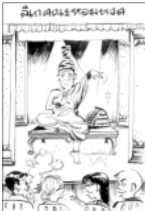
ผู้ปฏิบัติหน้าที่สมเด็จพระสังฆราช ดร.วิษณุ แต่งตั้ง

หลวงตา : เขาคงขบขันนะ นี่ละการ์ตูนเขาออกมาสองอย่างนี้ (เปรียบเทียบให้เห็นว่านี่ของจริง นั่นของปลอมครับ) องค์สมเด็จพระสังฆราช พระบาทสมเด็จพระเจ้าอยู่หัวทรงสถาปนามาเป็นของจริง (ดร.วิษณุ แต่งตั้ง เป็นคล้ายๆ เหมือนเล่นยี่เกละครละครับ) แล้วลีเกทอมหวล คนชวนชมด้วย เข้าใจไม่ใช่หรือ เอล่ะพอ