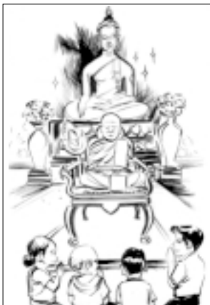
องค์สมเด็จพระสังฆราช พระเจ้าอยู่หัวทรงสถาปนา (แต่งตั้ง)