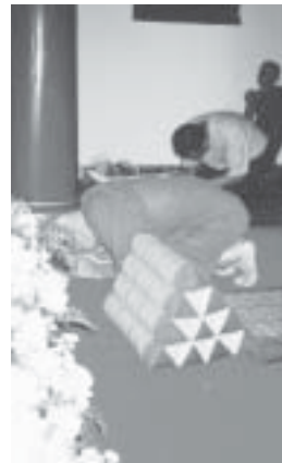
งานยกข่อฟ้าพระวิหารหลวงปู่มั่น ภูริทัตโต ณ วัดเจติยหลวง จ.เชียงใหม่ เมื่อวันที่ ๗ พฤศจิกายน ๒๕๔๖