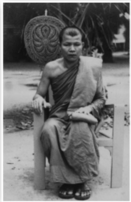
หลวงตามหาบัว ณ วัดป่าสุทธาวาส จ.สกลนคร (ถ่ายเมื่อ ๒๒ พฤษภาคม ๒๕๓๓)

อวิชชา นี้แหลมคมมาก ไม่มีอะไรแหลมคมมากกว่าอวิชชาซึ่งเป็นจุดสุดท้ายว่า ความโลภมันก็หยาบๆ พอเข้าใจและเห็นโทษได้ง่าย แต่โลกยังพอใจกัน โลก คิดดูซิ ความโกรธก็หยาบๆ โลกยังพอใจโกรธ ความหลง ความรัก ความชัง ความเกลียด ความโกรธอะไร เป็นของหยาบๆ พอเข้าใจและเห็นโทษได้ง่าย โลกยังพอใจกัน