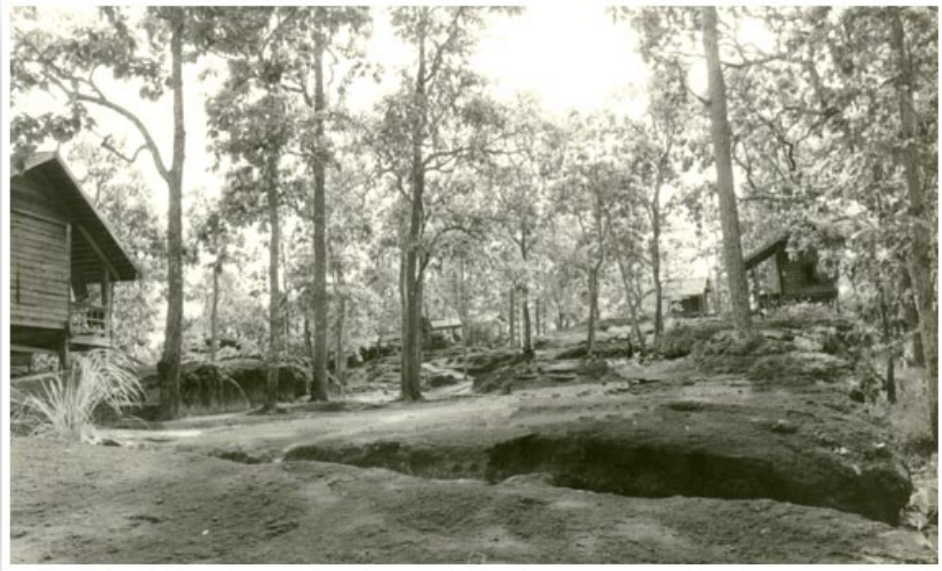
บริเวณวัดดอยธรรมเจดีย์ (ถ่ายเมื่อ ๑๒ พฤศจิกายน ๒๕๑๕)

ถึงขนาดนี้แล้ว ไม่มีใครที่จะสามารถรู้ได้เห็นได้ในโลกอันนี้ เพราะเหลือกำลังสุดวิสัยที่จะรู้ได้