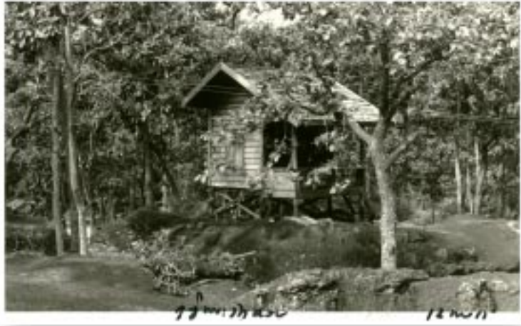
สภาพวัดดอยธรรมเจดีย์ (ถ่ายเมื่อ ๑๒ พฤศจิกายน ๒๕๑๕)