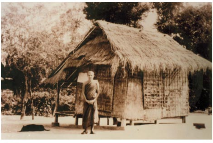
กุฏิกระต๊อบของหลวงตา ที่วัดป่าบ้านตาด สมัยต้นๆ