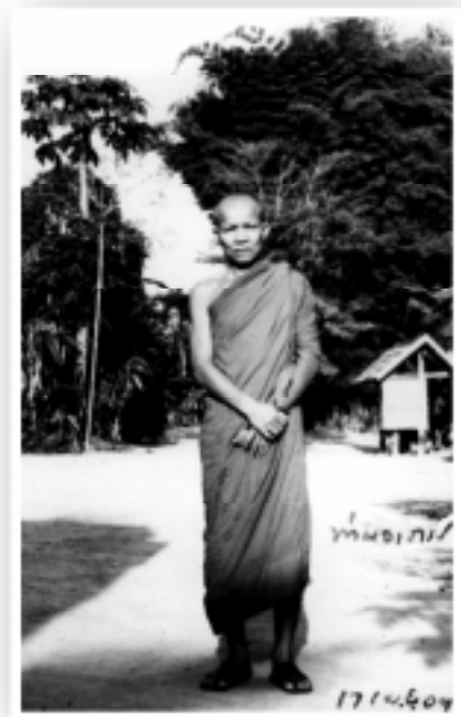
บริเวณวัดป่าบ้านตาด (ถ่ายเมื่อ ๑๗ เมษายน ๒๕๐๙)

ในขณะที่เปิดโอกาสตกลงกันเรียบร้อยแล้วนั้นนะ ไม่ว่าผู้คนหญิงชายรถราต่างๆ ต้องเข้าต่องออกกันตลอดเวลา ประตูวัดปิดไม่ได้เลย และสถานที่ที่จะสร้างโบสถ์ขึ้นมาให้เป็นของสง่างามแก่วัดแก่พระสงฆ์ในวัด แต่พระเถรกลับตายเป็นหมดจากจิตตภาวนา จากมรรคผลนิพพานที่ควรจะได้จะถึงจากสมณธรรม... คือ จิตตภาวนา แล้วจะเอาอะไรมาเป็นความสง่างามอร่ามตา