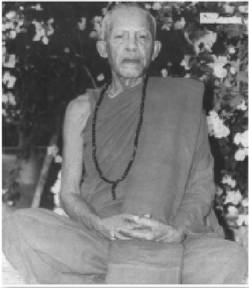
หลวงปู่ตื้อ อจลธัมโม

สอนไปอยู่ในป่า เสือก็มาอยู่ด้วย เสือโคร่ง ใหญ่ นะมันมาแอบอยู่ด้วย