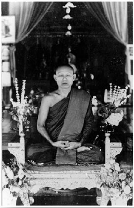
ท่านพอลลี ธัมมธโร