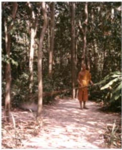
บิณฑบาตทางเดินจงกรม

เมื่อพระเถรจัดอาหารเสร็จเรียบร้อยแล้ว จากนั้นหลวงตาจะอนุโมทนาให้พรเสร็จแล้วพระเถรท่านจะพิจารณาอาหารในบาตรก่อนด้วย ปฏิสังขาย โนสัช เสร็จ