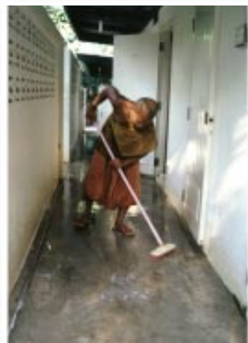
ทำความสะอาดห้องน้ำพระเณร-ภรรยา