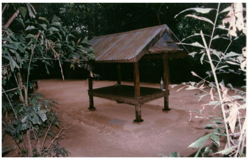
ที่พักข้างทางจกรมของหลวงตา