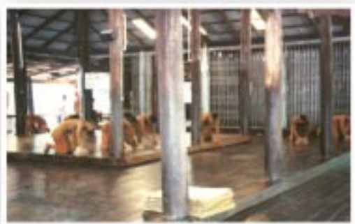
ช้ดฎูพื้นศาลา