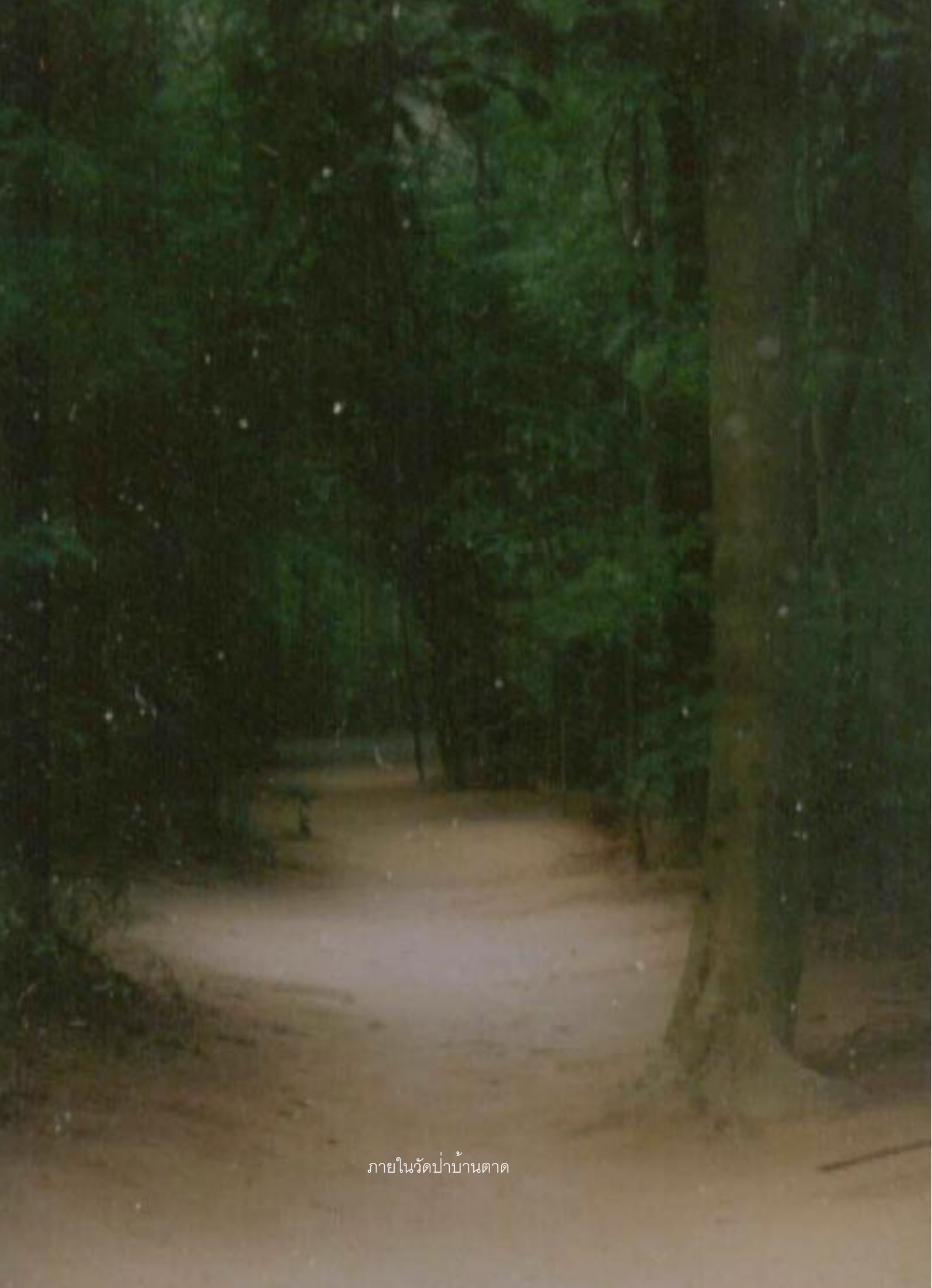
ภายในวัดป่าบ้านตาด