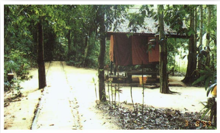
กุฏิและทางจงกรมของพระเณร

ด้านหัวนอนจะมีพระพุทธรูปหรือรูปครูบาอาจารย์ติดไว้ เพื่อกราบไหว้บูชา เป็นอนุสติและเป็นกำลังใจในการบำเพ็ญภาวนา รอบๆ รันมีบริเวณพอเหมาะไม่กว้างจนเกินไป