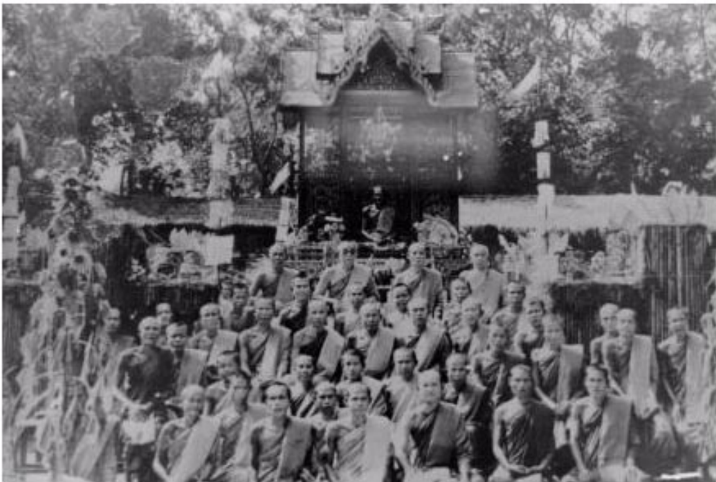
งานประชุมเพลิงศพท่านพระอาจารย์มั่น ภูริทัตโต ณ วัดป่าสุทธาวาส จ.สกลนคร วันอังคารที่ ๓๑ มกราคม พ.ศ. ๒๔๙๓ (ขึ้น ๑๓ ค่ำ เดือน ๓ ปีชาล)

ดังนั้น เมื่อเสร็จงานพิธีศพท่านอาจารย์มั่น พระเถรหลายสิบลูบต่างคอย-