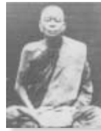
หลวงปู่ทองรัตน์ กนต์สิโล

ทางอุปถัมภ์ ไปหมดแหละ สายกรรมฐานอยู่ที่ไหน ๑ เราไปหมด จนกระทั่งถึงเขื่อนสิรินธร ที่ไหน ๑ วัดป่าเป็นสายของหนองป่าพง เราไป