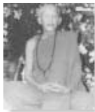
หลวงปู่ตื้อ อจลธัมโม