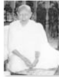
คุณแม่ชีแก้ว เสียงล้ำ

อย่างผู้เฒ่าแม่แก้วที่ท่านเคยเล่าให้ฟังว่า จะบวชเป็นเณรให้มันนะ อัฐิก็กลายเป็นพระธาตุแล้ว แม่ชีแก้วก็อย่างนั้นแล้ว ผู้หญิงก็แม่ชีแก้วคนหนึ่งก็อัฐิกลายเป็นพระธาตุ นี่ก็ลูกศิษย์ต้นของหลวงปู่มั่น ตั้งแต่แกยังเป็นสาวอยู่ ท่านหลวงปู่มั่น ท่านแนะนำสั่งสอน หลังจากนั้นมาแล้ว เวลาแก่ตายลงไปนี่ อัฐิของแกก็กลายเป็นพระธาตุ