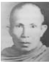
หลวงปู่กงมา จิรปัญโญ

นี่ละที่นี้ลูกศิษย์ลูกหาเข้ามาอบรมกับท่าน ก็หลักใหญ่ดีอย่างนี้แล้ว ส่วนเล็กส่วนย่อยไป ก็ต้องเอาจากหลักใหญ่ออกไป ๆ เวลาไปเป็นครู เป็นอาจารย์สอนใครที่ไหน จึงไม่ค่อยผิดพลาด เป็นที่แน่ใจ ๆ