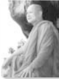
หลวงปู่จวน กุลเชษฐโฐ

ท่านจวน หลวงปู่ฝั้นก็เป็นนะ แต่ส่วนใหญ่ที่เก็บไว้นั้น ไม่เป็น เขาเอาไว้ในบ้านเป็น หลวงปู่ฝั้นก็แน่แล้วว่าเป็น แล้วก็ ท่านสิงห์ทองก็เป็น นี่เป็นหลานท่านมา ก็เคยอยู่ กับท่านมาแล้วเหมือนกัน นับมาตั้ง ๘-๙ องค์แล้วนะ เท่าที่ทราบมานี้เป็นพระธาตุแล้วทั้งนั้นนะ