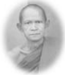
หลวงปู่มี ญาณมุนี

(ชาว อ.สูงเนิน จ.นครราชสีมา มานิมนต์รับผ้าป่าช่วยชาติ) อยู่ที่สูงเนิน รู้จักท่านอาจารย์มีไหม (รู้จักครับ) โห ท่านเมตตาเรามากนะ ท่านอาจารย์มี (พระครูญาณโสภิต) นะ เรารักเคารพท่านมาก นั่นละ ท่านเข้าในชั้นเพชรน้ำหนึ่งนะ เป็นลูกศิษย์หลวงปู่มั่น (หลวงปู่เสาร์ ด้วยครับ) เออ หลวงปู่เสาร์ หลวงปู่มั่น