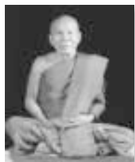
หลวงปู่หล้า เขมปัตโต

ส่วนพระนี้มีมาก เท่าที่จำได้นี้ ท่านหล้า ภูจ้อก้อ นี่ก็เป็นพระธาตุแล้ว หลวงปู่ตื้อ นี่ลูกศิษย์หลวงปู่มั่นนะ หลวงปู่ตื้อ นี่ก็กลายเป็นพระธาตุ โอ้ย สวยงามมากนะ เราไปเห็นด้วยตาเราเอง ให้พระเอาออกมาให้ดู พอทราบ ว่าองค์ไหนเป็นพระธาตุ ๆ เมื่อมีโอกาสแล้ว เราจะไปดูจนได้ ด้วยตาของเราเอง แล้วหายสงสัย ๆ